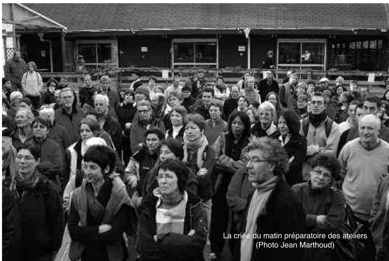
La criée du matin préparatoire des ateliers

Le vendredi soir, la grande famille du Yangjia Michuan se retrouve pour la signature d'une convention et consacre ainsi un partenariat fraternel entre les différentes écoles des différents conti-