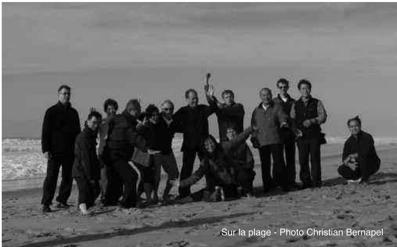
Sur la plage