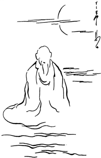
Lithographie de VIET-HO

Nous invitons les membres n'ayant pas reçu notre courrier initial (changement d'adresse) ou les enseignants désireux d'adhérer (charte du collège et demande d'admission ci-jointes) à prendre contact.