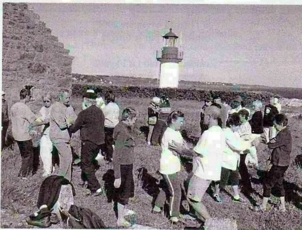
Et la pratique se prolongeait tard dans la nuit... à la lumière du phare.