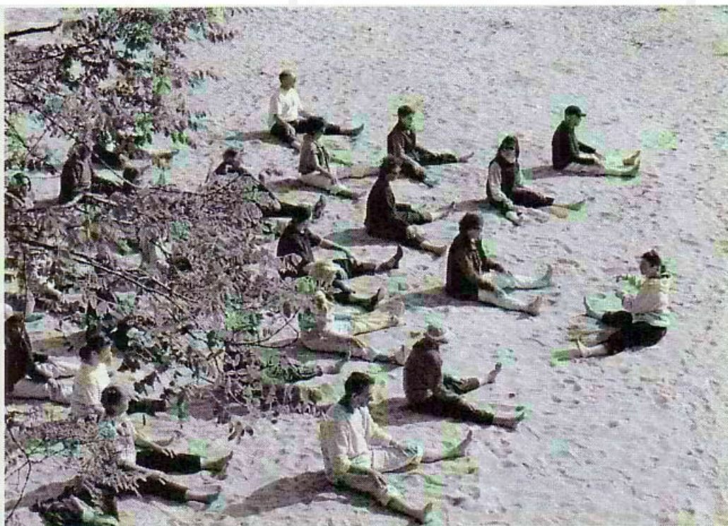
Un vrai entraînement « commando » ! Tiendront-ils jusqu'au bout ?