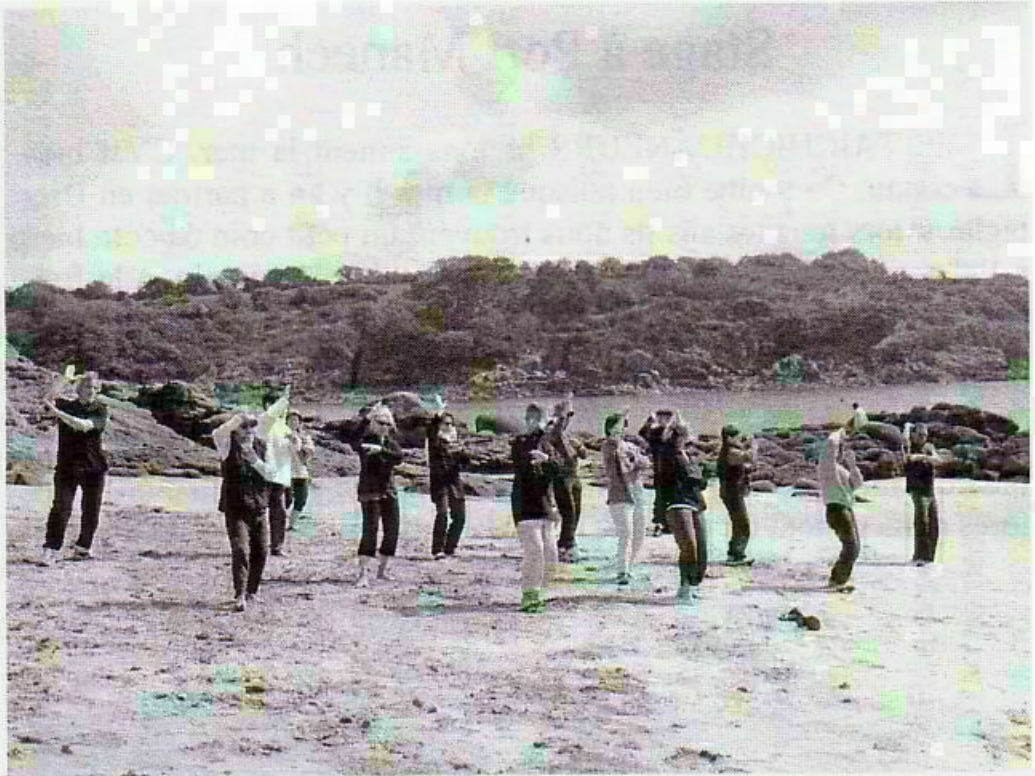
Les pêcheurs de Port Manech ne connaissaient pas cette danse bretonne.