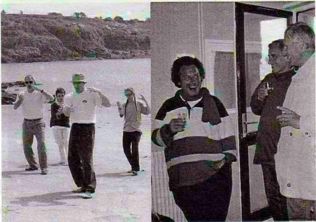
Et après l'effort on a droit à un petit verre de Chouchen.