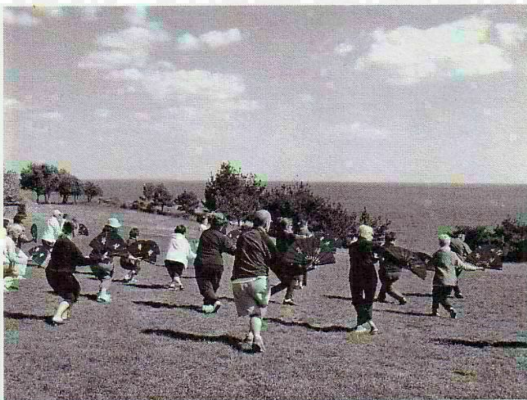
Sea, Fan and Sun