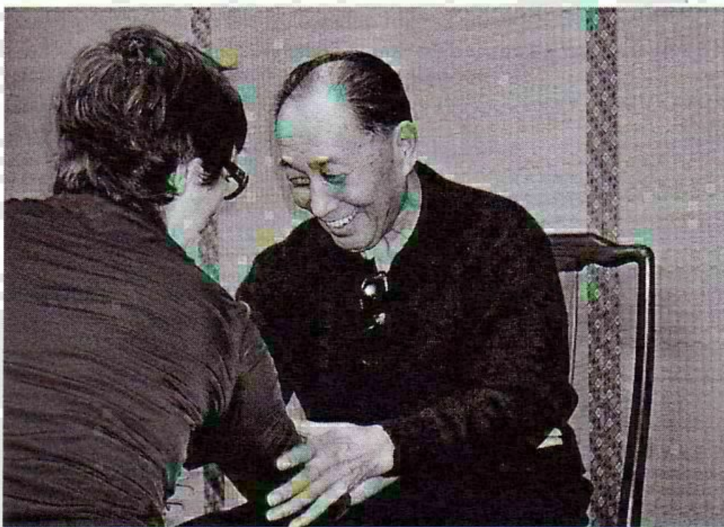
Laoshi nous montre que l'on peut pratiquer le tuishou ... assis, à condition de tourner le bassin.