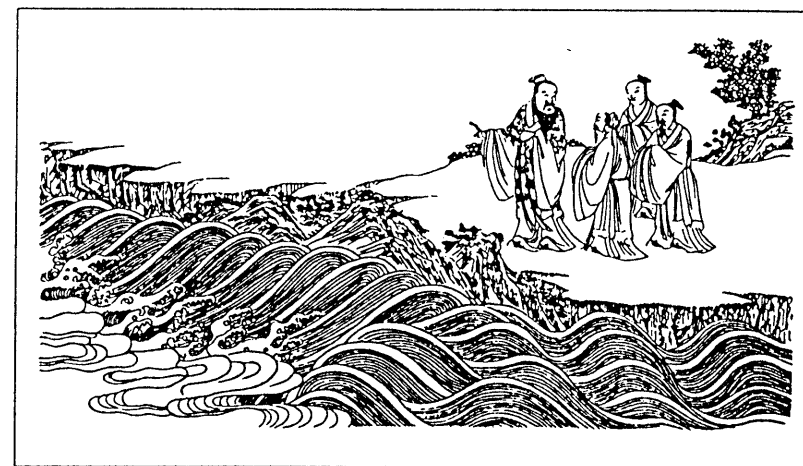
Confucius et ses disciples sur le rivage